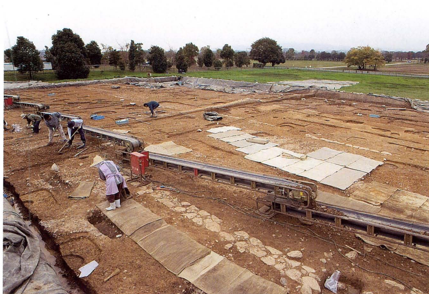
発掘調査の進む東院地区

Nara palace site, partially advanced reconstruction(right; reconstructed Eastern Palace Garden, center;reconstructed foundation platform of the Latter Imperial Audience Hall, left; the Former Imperial Audience Hall under reconstruction)