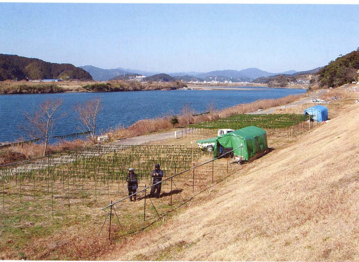
景観研究室 四万十川流域(高知県)の文化的景観調査

Historical Document Section: Investigating old documents at Yakushiji temple, Nara