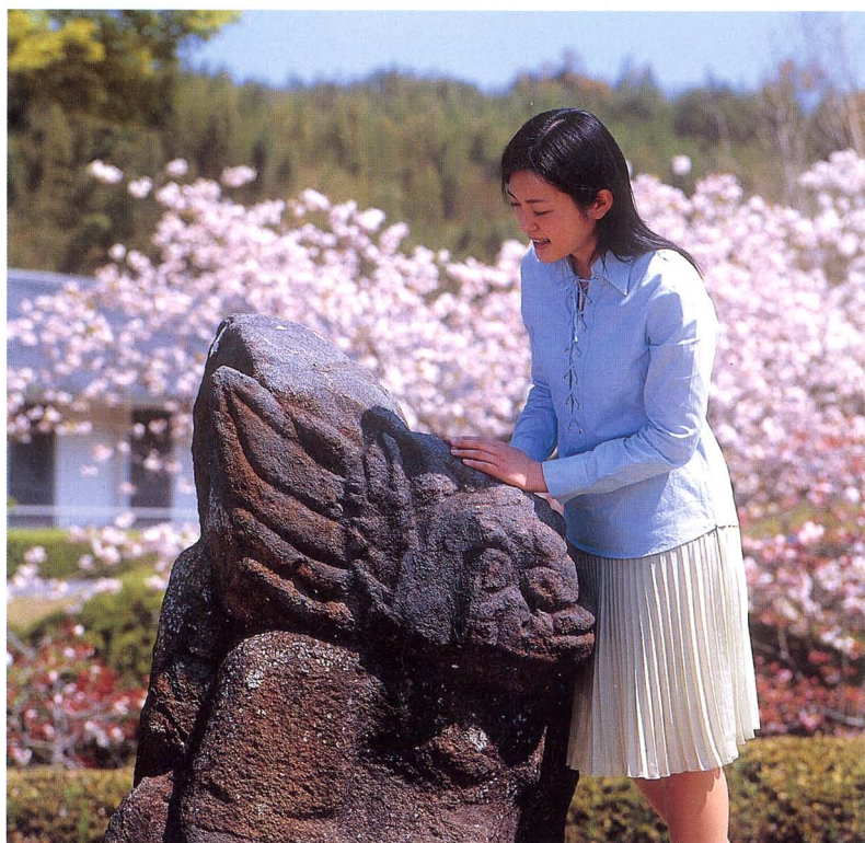
石造物の屋外展示(前庭)