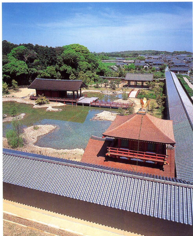
復原された東院庭園

This Department is in charge of archaeological investigations at the Nara palace site, where facilities were established for the emperor to rule during the Nara period (710-784), along with the imperial domicile and government offices. Since 1954, coordinated investigations of the site have been in progress, with excavation of nearly 30% of the 130 hectare site being completed, resulting in many discoveries important for the study of ancient history. In addition, excavation and research on residences of aristocrats, lower officials, and commoners are carried out in the surrounding Nara capital site, along with investigations of public market places, temples, and other sites, bringing to light many historical facts which have lain buried for over 1200 years. Excavated portions of the site are presented to the general public in various ways which convey the original appearance of the Nara palace site. These include reconstructing the foundation platforms where buildings once stood, planting shrubs to indicate the positions of a building's pillars, or reconstructing the facilities themselves, as in the case of Suzaku Gate and the East Palace Garden. The aim of excavation is to clarify the historic past through the analysis of artifacts and features that survive in archaeological sites. Archaeological excavation and the processing of great volumes of primary data obtained from ancient sites are vital tasks which further research on ancient history.