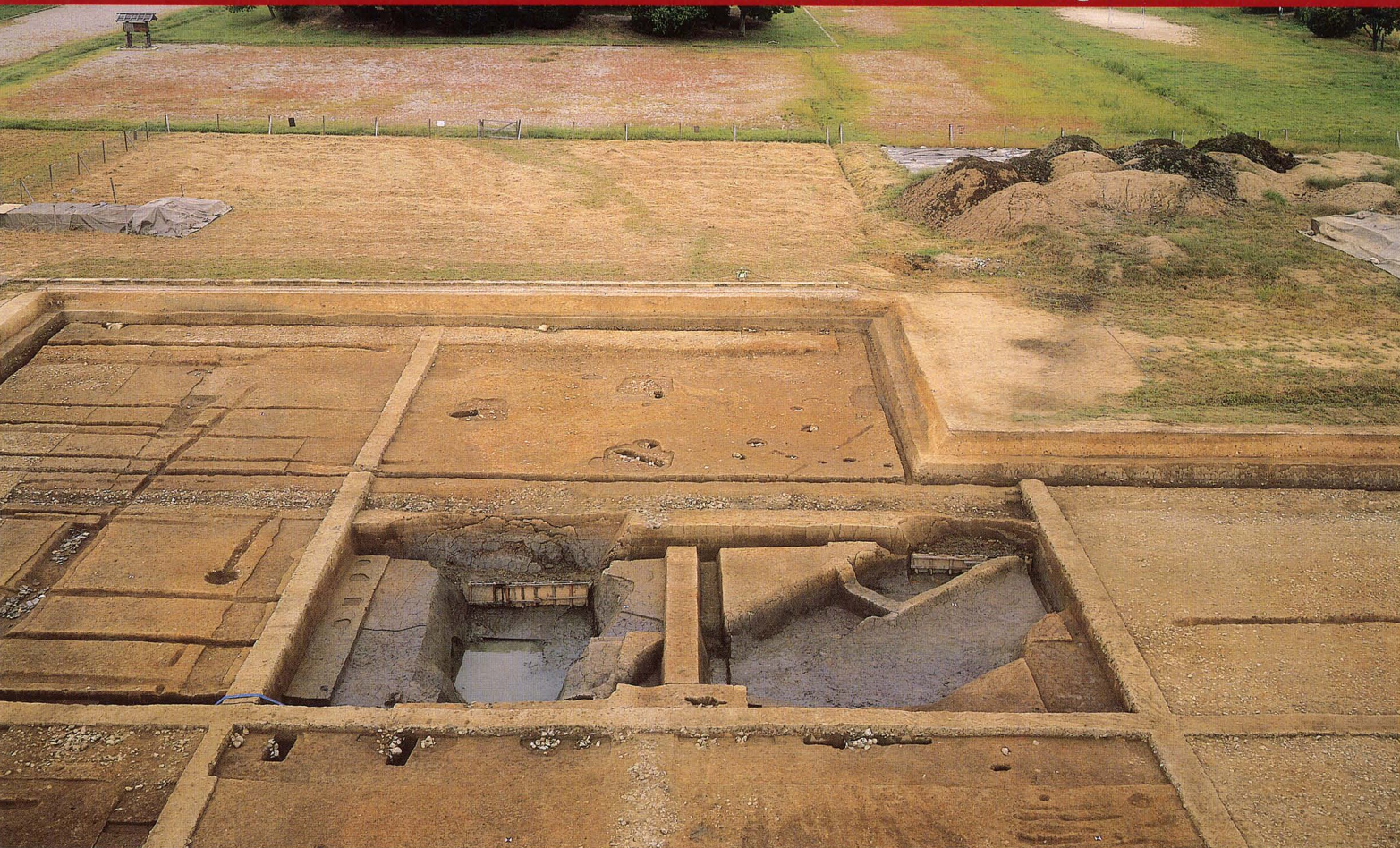
特別史跡藤原宮跡 朝堂院朝庭の調査（南から）

儀式の場として使用された踏敷広場や幡遺構を検出するとともに、藤原宮造営のために造られた運河を発掘した。奥に大極殿の基壇がみえる。