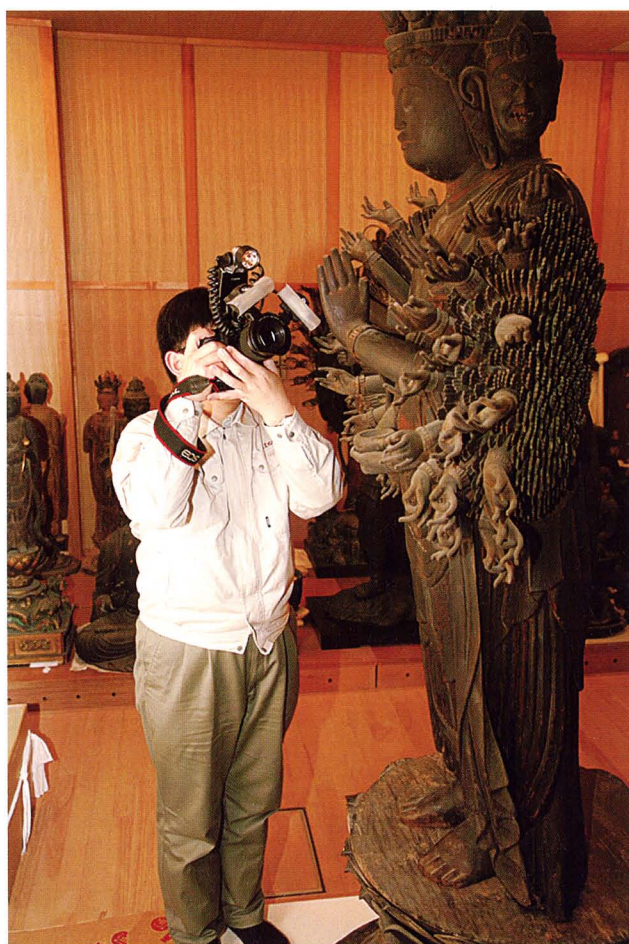
善勝寺（滋賀県）千手観音立像の年輪年代調査

Dendrochronological research of the Standing Thousand-armed Kannon owned by Zenshoji