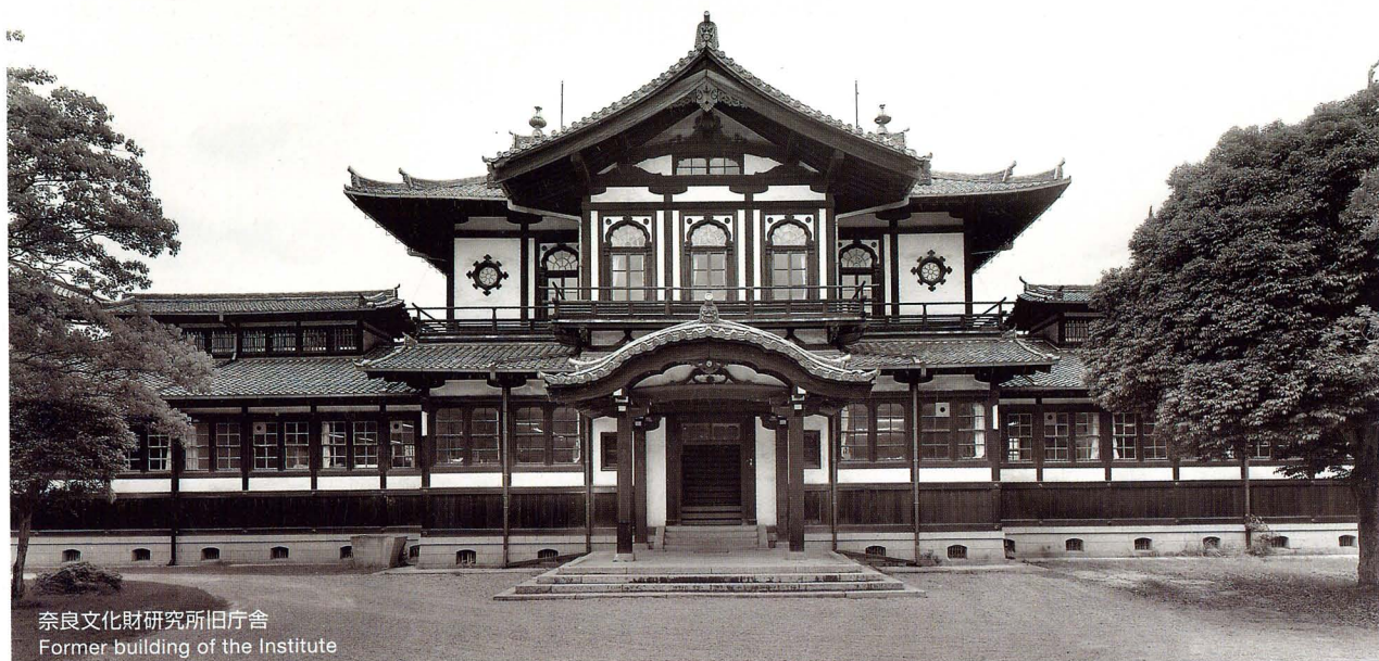
奈良文化財研究所旧庁舎 Former building of the Institute

As part of the Japanese Government's reform initiatives, national research institutes belonging to government ministries and agencies are undergoing reorganization. Consequently, the National Research Institute for Cultural Properties, Tokyo, and the Nara National Cultural Properties Research Institute were integrated and reorganized as branches of the Independent Administrative Institution in April 2001. Further, in April 2007, the Nara National Research Institute for Cultural Properties became one unit of the Independent Administrative Institution National Institute for Cultural Heritage, created through a merger with the Independent Administrative Institution, National Museums.