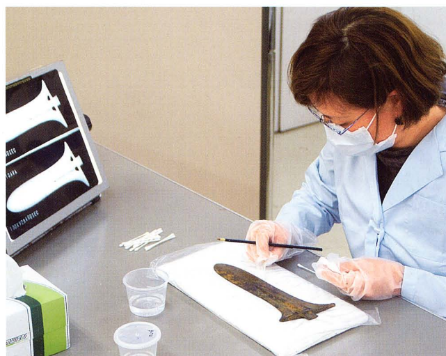
柳沢遺跡（長野県）出土銅戈の保存修理

The Center makes information about its activities public by publishing the research results of each section regularly in the CAO News.