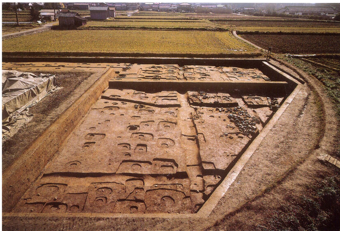
石神遺跡 2008年度発掘調査区（北から）

The paved courtyard used for ceremony, with the features of flagstaves, was revealed. A feature of canal that was excavated for construction of the palace was also ascertained there. To the rear can be seen the foundation platform of the Imperial Audience Hall.