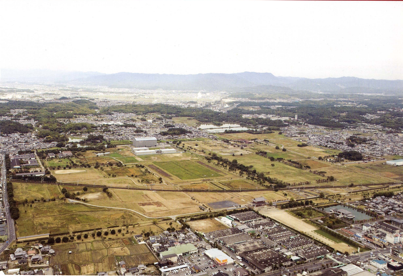
整備の進む平城宮跡(右から整備された東院庭園・第二次大極殿基壇・復元の進む第一次大極殿正殿)

Nara palace site, partially advanced reconstruction(right; reconstructed Eastern Palace Garden, center;reconstructed foundation platform of the Latter Imperial Audience Hall, left; the Former Imperial Audience Hall under reconstruction)