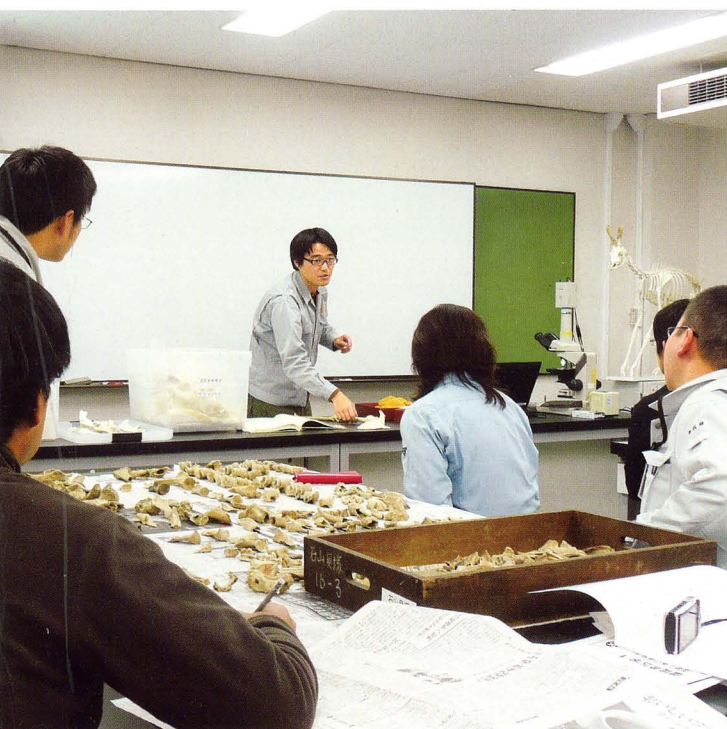
環境考古学の研修風景

An archaeological prospection by the resistivity meter