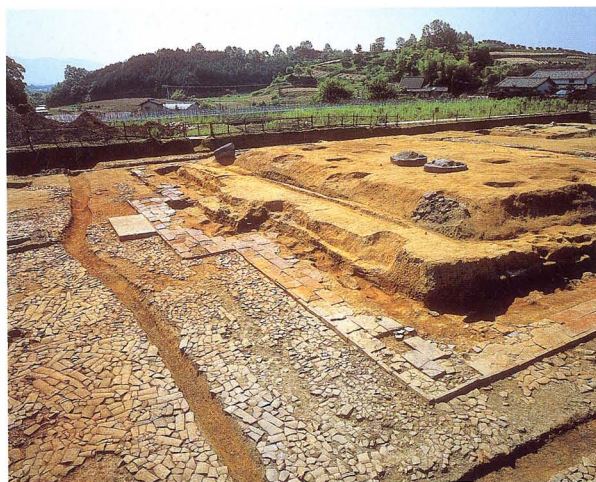
山田寺跡 金堂基壇と周囲の瓦敷き舗装

当調査部では、これら遺跡の発掘調査を通じて、古代国家の具体的な歴史像を復原すべく、学際的な調査研究をおこなっています。その成果は、遺跡発掘調査説明会や報告書類、藤原宮跡資料室などで公開するとともに、遺跡の保存・活用に取り組んでいます。