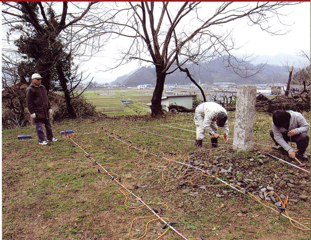
電気探査法による遺跡の探査

An archaeological prospection by the resistivity meter