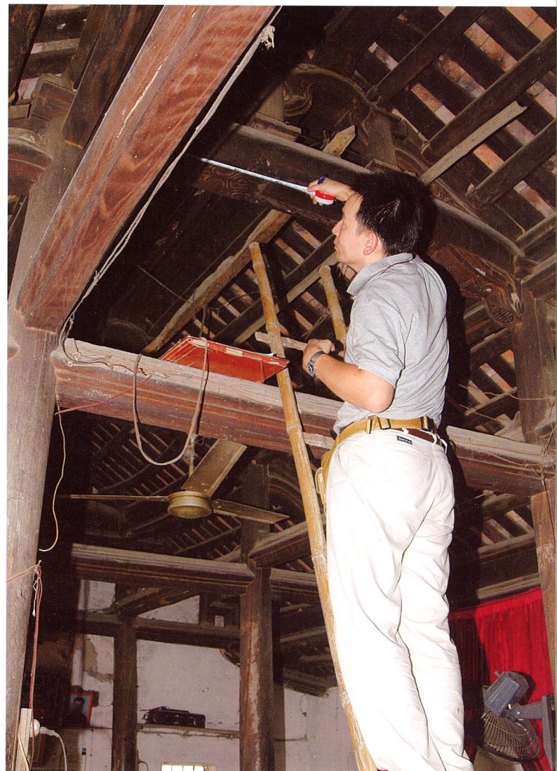
建造物研究室 重要文化財堀内家住宅(塩尻市)の建造物調査

Site Stabilization Section: Joint Research Session on Site Preservation and Conservation Science (30-31, Jan 2009)