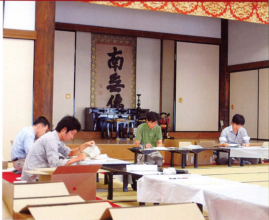
歴史研究室 薬師寺の古文書調査

Historical Document Section: Investigating old documents at Yakushiji temple, Nara