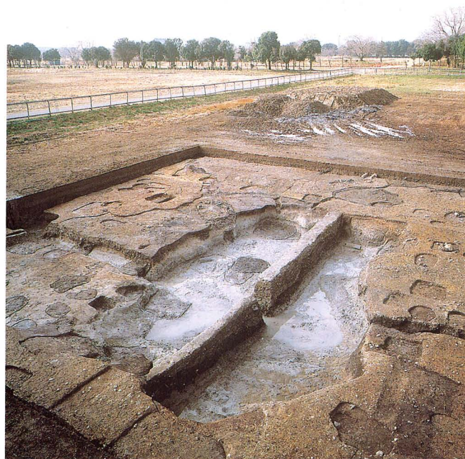
平城宮東方官衙の木簡や檣扇が大量に捨てられていた土坑

Pit in which a large amount of wooden writing tablets (mokkan) or folding fans were dumped at the eastern government office compound area, the Nara palace site